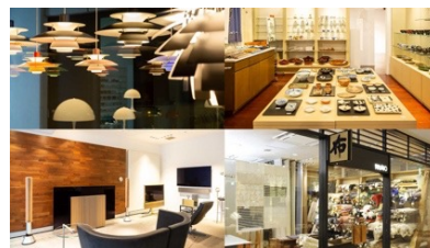
デザイン発信拠点「AXIS」内のショップ、ショールーム