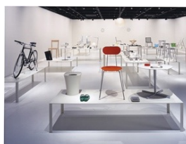
「スーパーノーマル展」(2006年)