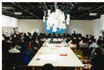
AXIS Gallery 企画展 「AXIS THE COVER STORIES —聞く・考える・話す、未来とデザイン」(2018年)