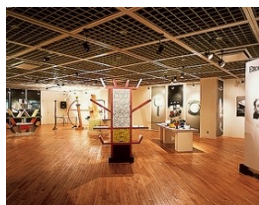
「エットレ・ソットサス展」(1981年)

AXIS Galleryは「生活とデザインを文化的なレベルで高めていく」という強い思いからスタートしました。設立時には、デザイングループ「メンフィス」など先鋭的な活動で知られたポストモダンの旗手エットレ・ソットサスを招き第1回企画展を開催し、日本にいち早くポストモダンの思想を紹介しました。以降も、情報デザインの先駆けとなった「リチャード・ソール・ワーマン 情報のデザイン展」や、深澤直人とジャスパー・モリソンをゲストキュレーターに迎えた「スーパーノーマル展」、ソーシャルデザインという考え方を広めるきっかけとなった「世界を変えるデザイン展」など、社会の今とこれからに向けた発信をつづけています。