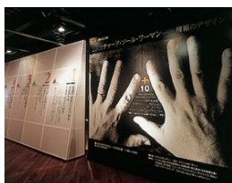
「リチャード・ソール・ワーマン 情報のデザイン展」(1991年)