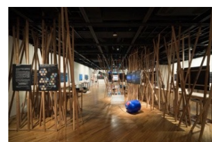
「世界を変えるデザイン展」(2010年)